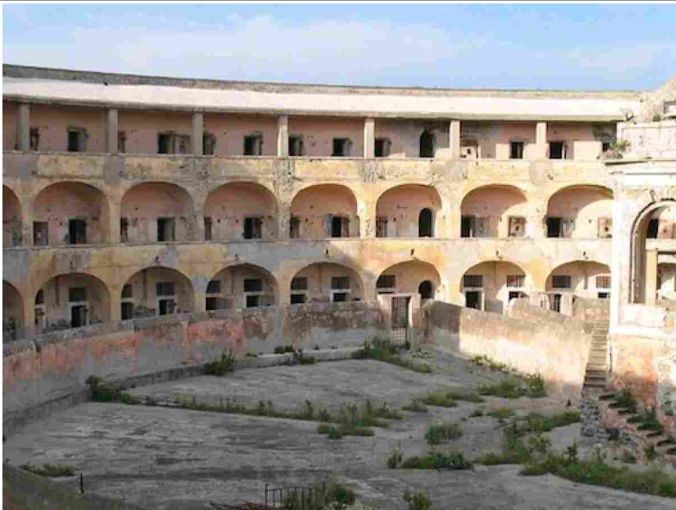
CARCERE DI SANTO STEFANO