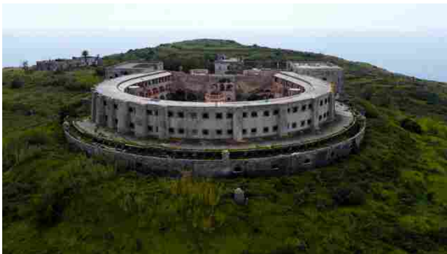
L'ex carcere di Santo Stefano

C 'è stata lo scorso 14 luglio una nuova riunione del Tavolo istituzionale permanente delle Amministrazioni pubbliche firmatarie del Contratto Istituzionale Sviluppo di Santo Stefano/Ventotene, a cui ha partecipato anche l'Autorità di Gestione del Pon Cultura e Sviluppo del MiC e l'architetto Lisa Lambusier, nuova Sovrintendente ai Beni Culturali territorialmente competente, alla presenza di Invitalia, soggetto attuatore del progetto.