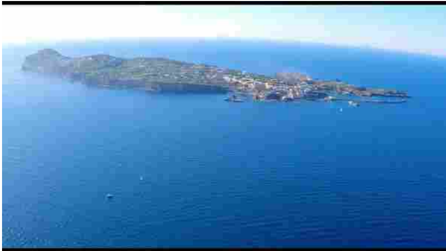
L'isola di Ventotene