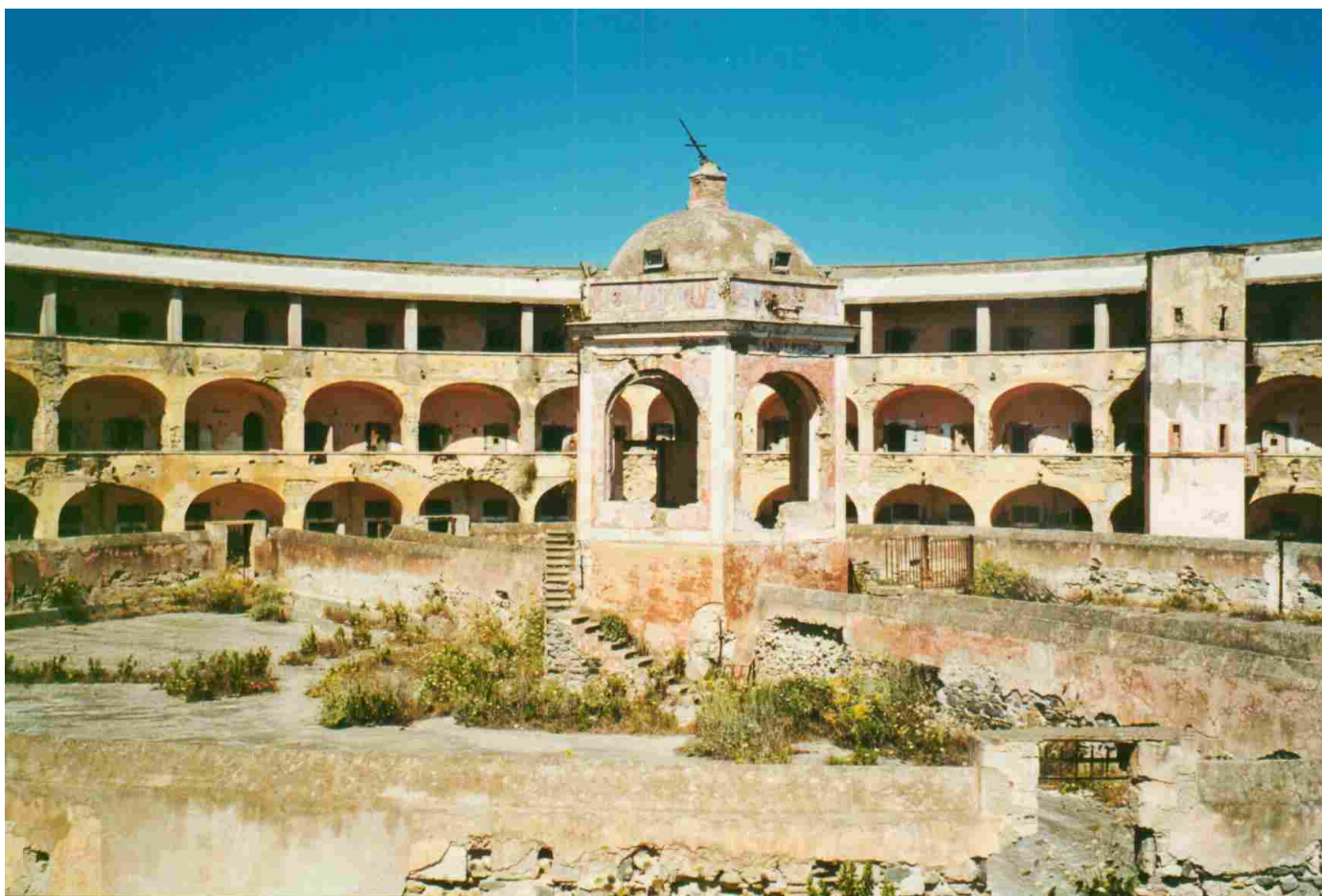
Carcere di Santo Stefano

di Comunicato Stampa - 31 Gennaio 2022 - Politica